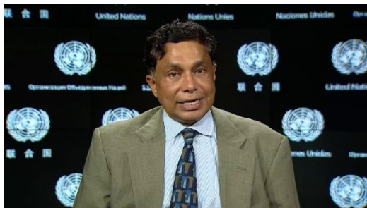
Біріккен Ұлттар Ұйымының «Академиялық ықпал» бағдарламасының жетекшісі Раму Дамодаран

Сіздерді тағы да көргеніме қуаныштымын, сәлеметсіздер ме!