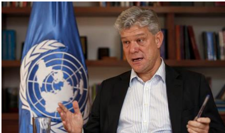
Біріккен Ұлттар Ұйымы Бас Хатшысының Орынбасары Фабрицио Хохшильд-Драммонд

БҰҰ-ның Нью-Йорктегі Штаб-пәтерінен жылы лебіз!